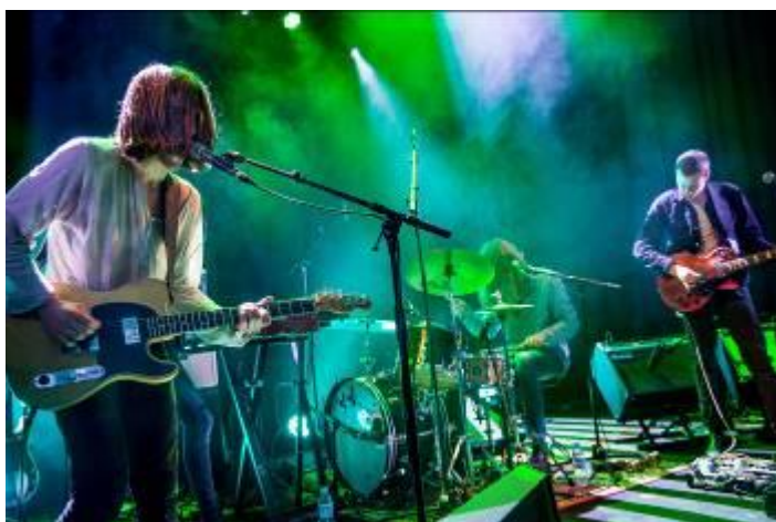
The Psychotic Monks, lauréat du Prix Chorus 2018

> Audition mercredi 19 décembre : SuperParka, Arthur Ely, Mikano, Poté, Johan Papaconstantino.