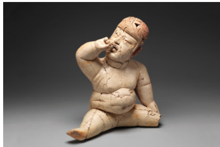
Figure assise Olmèque, XII e -XIII e s. av. J.-C. © Metropolitan Museum of Art, New York

En quelques étapes, riches de merveilles et d'apprentissages, découvrez les principales cultures précolombiennes, celles du bassin méditerranéen de l'Islam et leur production matérielle, par l'expérience visuelle et avec toutes les clés de lecture nécessaires pour comprendre le contexte, le sens, le vocabulaire formel et stylistique des œuvres abordées en architecture, peinture, sculpture, arts décoratifs, arts précieux.