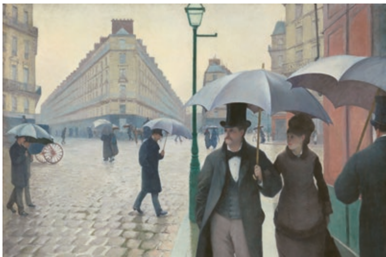
Gustave Caillebotte, Rue de Paris, temps de pluie

Conférencière en histoire de l'art diplômée en muséologie